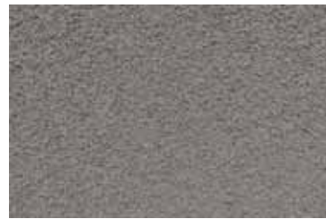
Cód: 15 gris oscuro