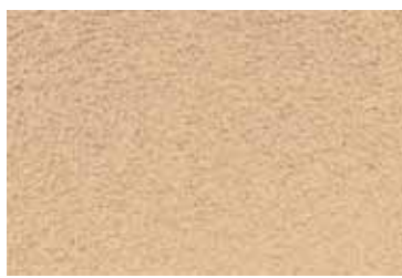
Cód: 02 beige rosado