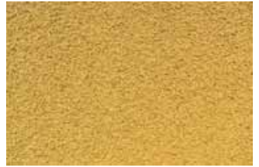
Cód: 08 naranja claro