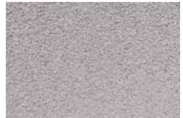
Cód: 16 gris claro