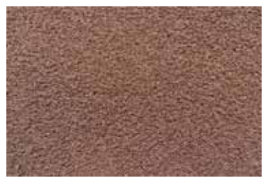
Cód: 04 marrón chocolate