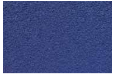
Cód: 12 azulón