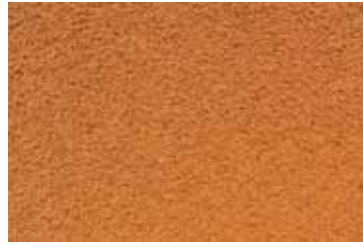
Cód: 07 naranja