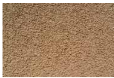
Cód: 03 marrón