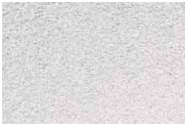
Cód: 13 blanco