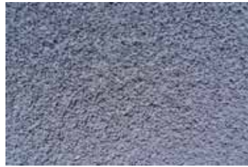
Cód: 11 azul claro