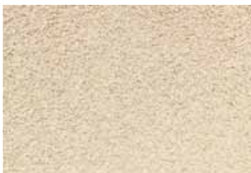
Cód: 01 beige