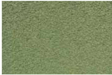
Cód: 10 verde caqui