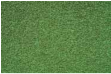
Cód: 09 verde prado