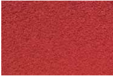
Cód: 05 granate