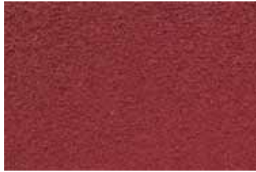
Cód: 06 burdeos